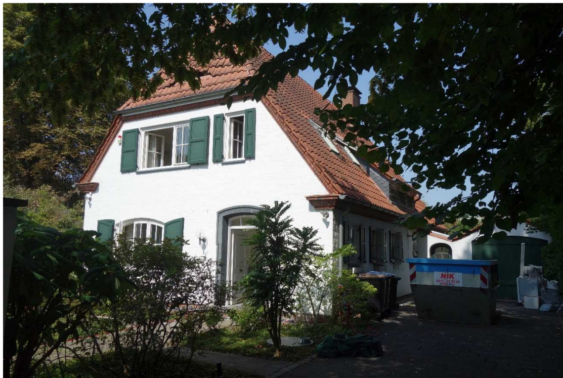
Meerbusch Büberich, Wohnhaus ‚An den Linden 30‘, Südgiebel und östliche Traufseite, Foto: Nadja Fröhlich (NF), LVR- ADR, 2025