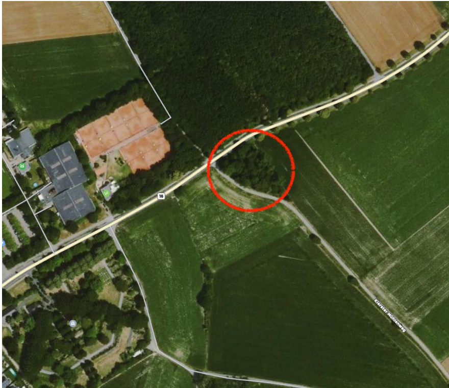
Abbildung 1 Standort "Kruuse Boom"