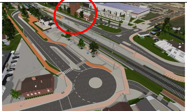
Abb.1b: Aktuelle Planung (Stadt Meerbusch: 2019-06-27_14_37_07-WorldInsight.png)