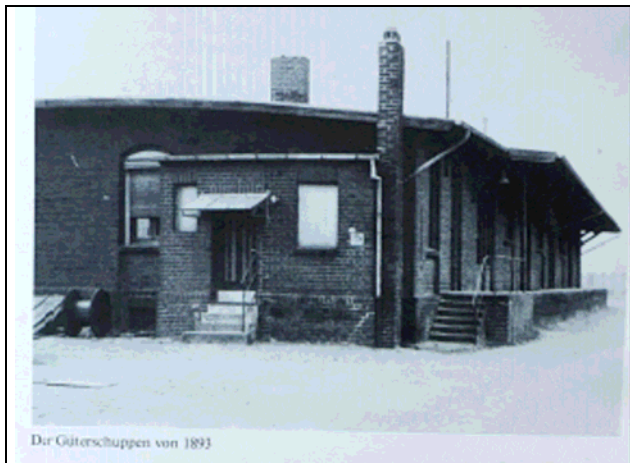
Der Güterschuppen von 1893

Güterschuppen: Der Güterschuppen wurde 1893 gebaut. Nachdem die Bundesbahn Anfang der 1970er Jahre den Stückgutverkehr in Osterath aufgab, wurde er vom Landhandel genutzt (Kempkens 1985). Der Güterschuppen ist offensichtlich ohne substantielle Veränderungen am Außenbau sowie im Inneren erhalten.