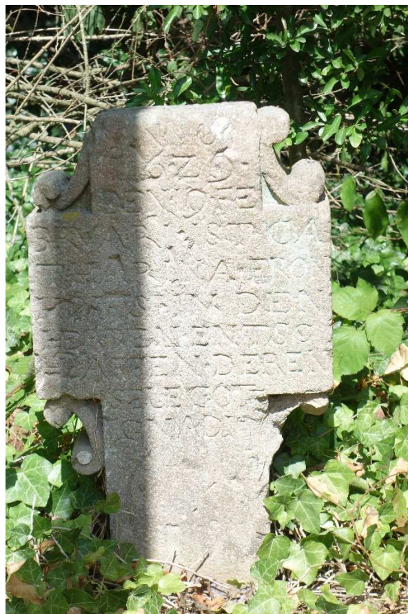
Meerbusch-Büderich, Dorfstraße, Grabstein, Foto: Nadja Fröhlich, LVR-ADR, 2019.