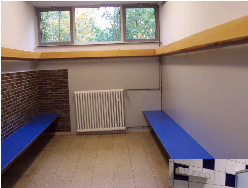
Renovierte Herrenumkleide (Stand Oktober`05)