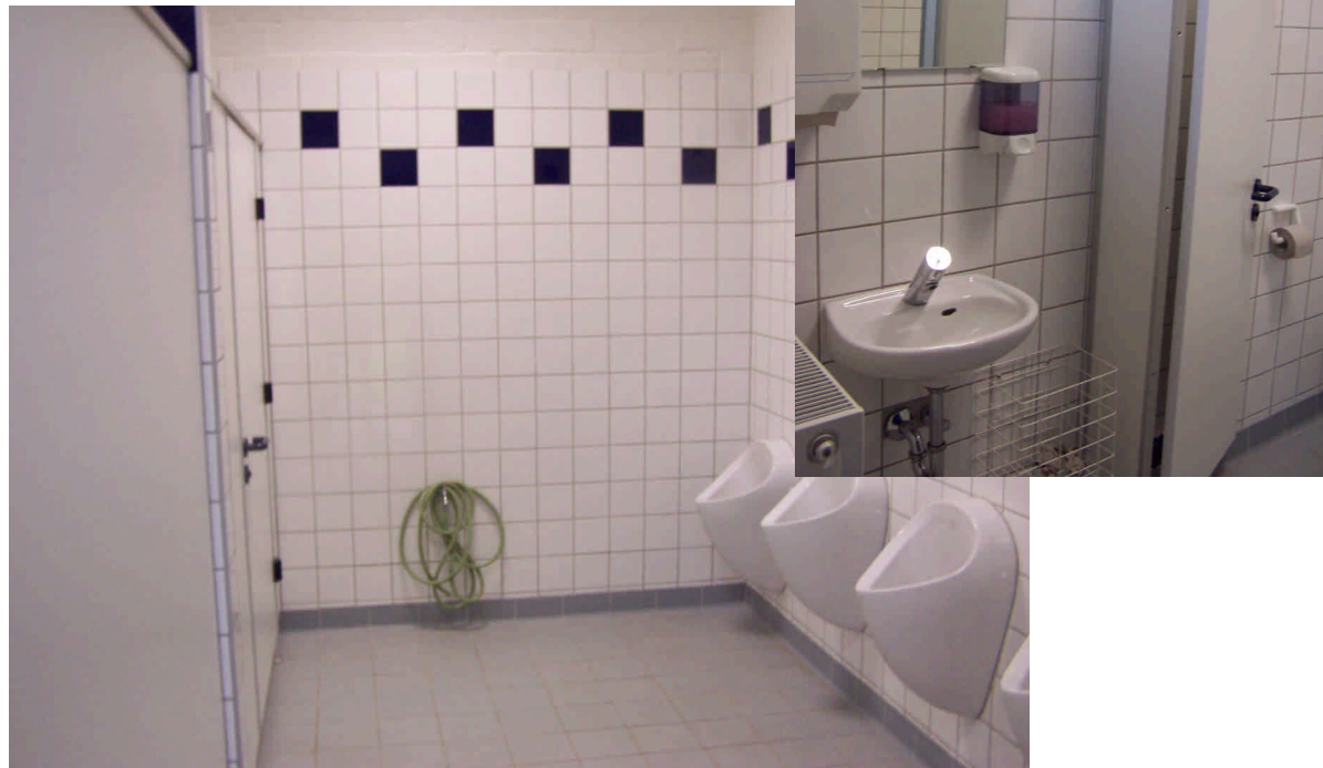
Sanierte Herren WC