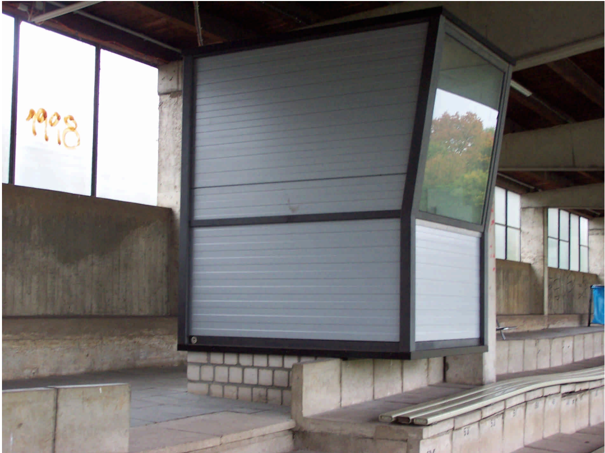
Sprecherkabine auf der Tribüne